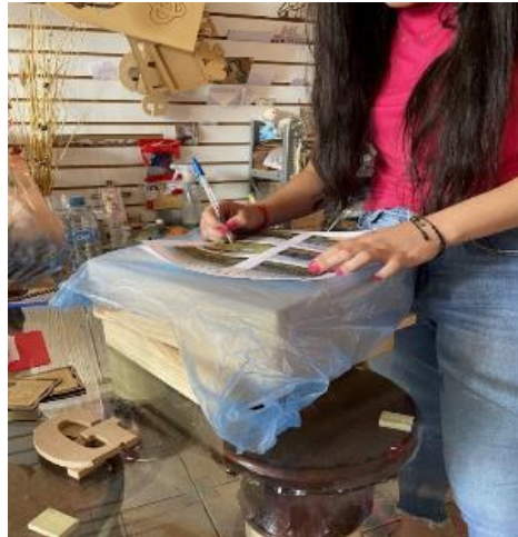
Figura 6. Aplicación de la actividad.

Tomada el 20 de septiembre del 2022.