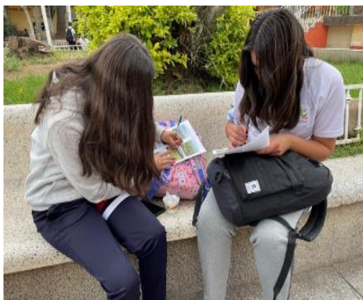
Figuras 4 y 5. Aplicación de la actividad.