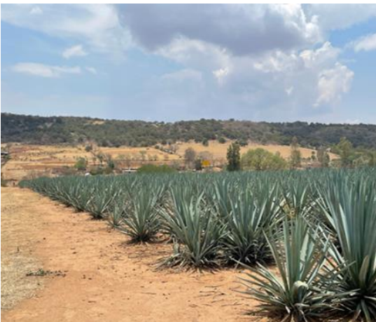
Par E y F.