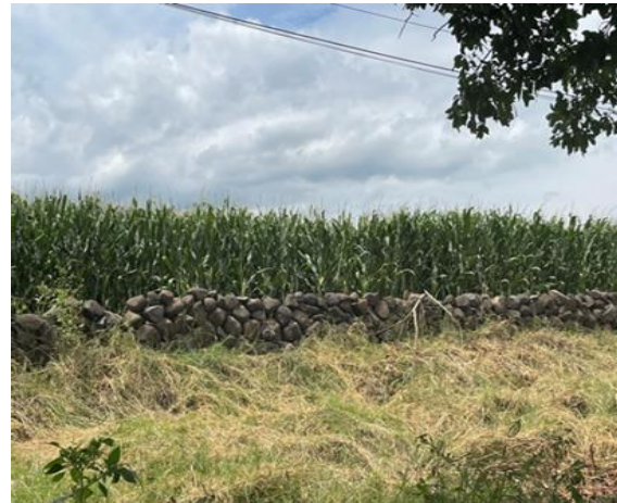
Par E y F.